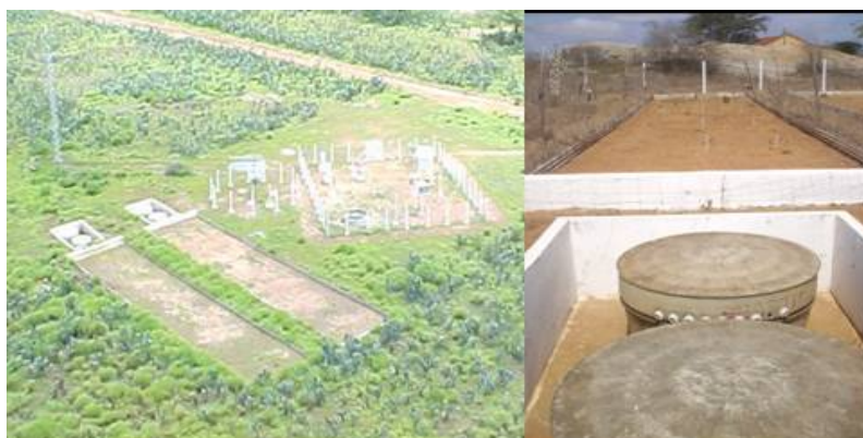
Figura 1. Parcelas de erosão tipo Wischmeier.

Foram utilizados dados de chuva obtidos na estação climatológica de superfície e de lâmina escoada e produção de sedimentos de duas parcelas de erosão tipo Wischmeier (100,0 m 2 ) instaladas na bacia experimental de São João do Cariri (7° 23' 27" S e 36° 32' 2" O), região do cariri ocidental, semiárido paraibano, no período de 1999 a 2001. Neste período uma das parcelas foi mantida desmatada (P1) e outra em regime de pousio (P2). A cobertura vegetal da parcela 1 foi removida sem auxílio de equipamentos como enxada ou chibanca, usando apenas as mãos e em um período onde o solo permanecesse seco, para evitar a sua compactação. Neste mesmo período não houve acesso de animais de pequeno ou grande porte, como bovinos, caprinos e ovinos. Na parcela 2, que permaneceu em regime de pousio, foi possível observar a cobertura vegetal rasteira com predominância de gramíneas em toda a área da parcela no final do ano de 2000. As parcelas 1 e 2 possuem declividade de 3,4% e 3,6% respectivamente. As coletas ocorrem sempre que o escoamento superficial cessa. A Figura 1 mostra as parcelas 1 e 2 no ano de 2000 e um detalhe da parcela P1 no ano de 2012.